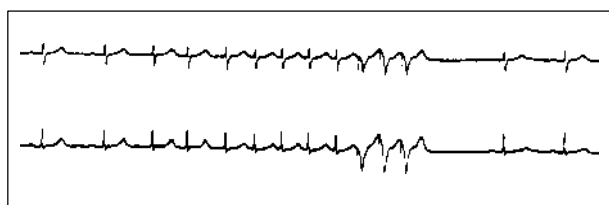
Episódio de taquicardia supraventricular paroxística interrompida pelo PASAR 4171 implantado em ventrículo direito, documentado por eletrocardiografia dinâmica.

Em dois pacientes houve falha na interrupção da taquicardia; em um destes pacientes foi observada ainda a indução de taquicardia supraventricular pelo marcapasso. Estas intercorrências foram superadas pela reprogramação.